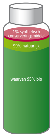
VOLGENS COSMÉBIO/ ECOCERT LABELS

*voorbeeld uit het Ecocert charter van 16.01.03