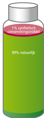
VOLGENS BDIH LABEL