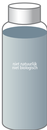
VOLGENS NATRUE LABEL